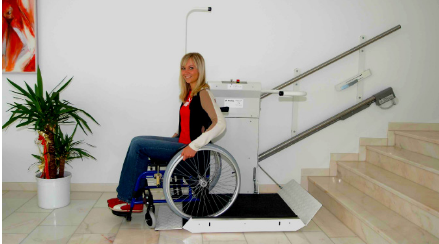
Un plataforma elegante y moderna